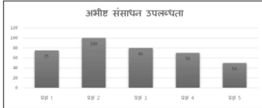
लेखाचित्र 1.1 - ऑनलाइन शिक्षण-अधिगम में अभीष्ट संसाधनों की उपलब्धता।

इन प्रतिक्रियाओं का आनुपातिकमान 75 है जो मध्यमान से पर्याप्त अधिक है। इस प्रकार कहा जा सकता है कि अभीष्ट संसाधनों की उपलब्धता के मानक पर प्रतिभागियों की प्रतिक्रिया अति उत्साहप्रद है। ज्ञातव्य है कि