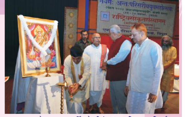
युवमहोत्सवस्य सम्पूर्तिसत्रे दीपं प्रज्वलयति कुलपतिवर्यः