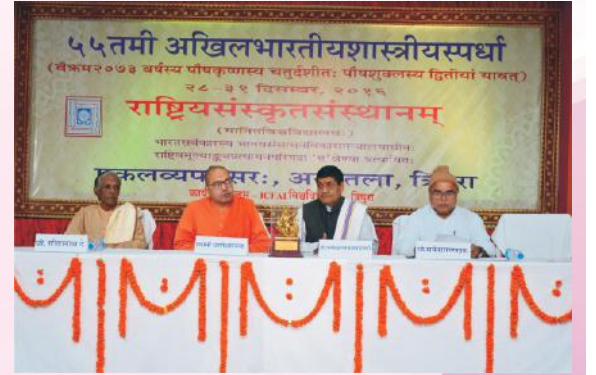
समापनसत्रे मञ्चासीनाः अतिथयः

अखिलभारतीयशास्त्रीयस्पर्धासु राज्यस्तरे चिताः २४ राज्येभ्यः समागताः ३२० अधिकाः प्रतिभागिनः सम्मिलिताः अभूवन्। भाषणस्पर्धा, शलाकापरीक्षा, कण्ठपाठस्पर्धा, शास्त्रार्थविचारः, समस्यापूर्तिः, अक्षरश्लोकी चेत्याहत्य २४स्पर्धाः प्रावर्तन्त। प्रत्येकं स्पर्धासु विजयिनः प्रथम-द्वितीय-तृतीयपुरस्कारेण स्वर्णरजत-कांस्यपदकानि समाप्नुवन्। सर्वस्पर्धासु अधिकान् अङ्कान् अवाप्य कर्णाटकराज्यस्य स्पर्धालुगणः विजयवैजयन्त्या व्यभूषयत्।