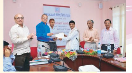
प्रमाणपत्रं वितरति कुलपतिमहोदयः