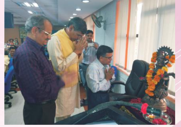
उद्घाटनकार्यक्रमस्य एकं दृश्यम्

भारतसर्वकारस्यादेशानुसारं ३१. १०.२०१६ तः ०५.११.२०१६ पर्यन्तं सतर्कताजागरूकतासप्ताहः ३१.१०. २०१६ तः ०६.११.२०१६ पर्यन्तं राष्ट्रिय- एकतासप्ताहश्च राष्ट्रियसंस्कृतसंस्थानस्य मुख्यालये समाचरितः। कार्यक्रमम्