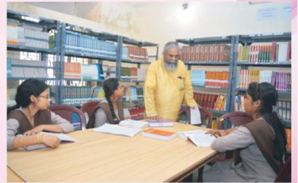
निरीक्षणं विदधानः आचार्यः रामानुजदेवनाथवर्यः