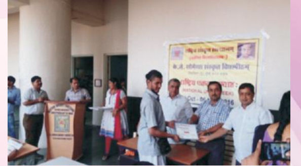
सतर्कतासप्ताहे प्रमाणपत्रं वितरन्तः अध्यापकाः