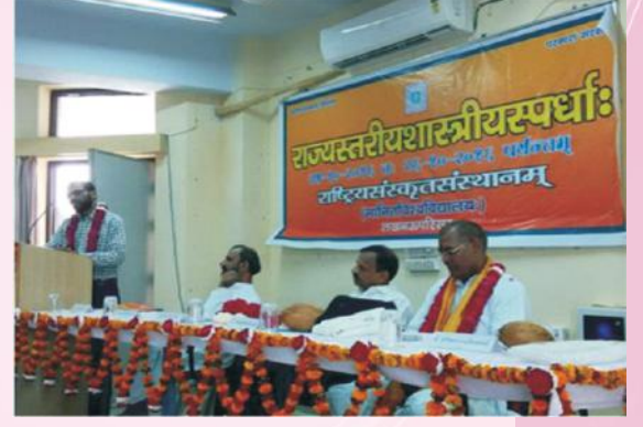
अधिमञ्चं विराजमाना: अतिथयः