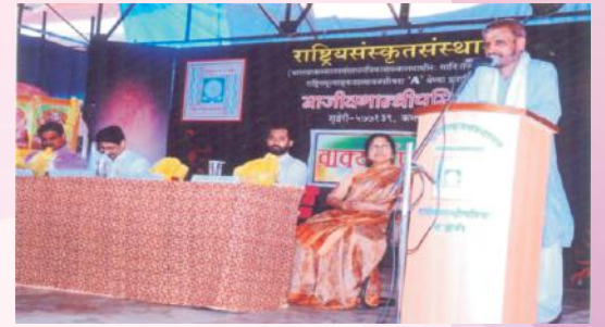
वाक्यार्थपरिषदः एकं दृश्यम्

अक्टोबरमासे १६ तः २५ पर्यन्तं शिरसिमण्डलस्य गोळी प्रान्ते श्री सिद्धिविनायक-मन्दिरे प्रवृत्ते संस्कृतसम्भाषणप्रशिक्षणवर्गे परिसरस्य शिक्षाशास्त्रच्छात्राः भागं गृहीतवन्तः। सन्दर्भेऽस्मिन् विभागीया अध्यापकाः मार्गदर्शकरूपेण गताः।