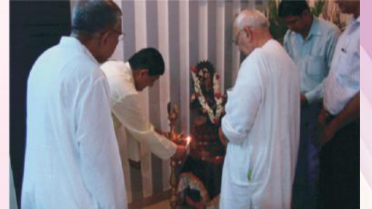
कार्यशालायाः उद्घाटनं विदधानः कुलपतिमहोदयः