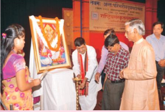
युवमहोत्सवं दीपप्रज्वालनेन उद्घाटयन् कुलपतिवर्यः