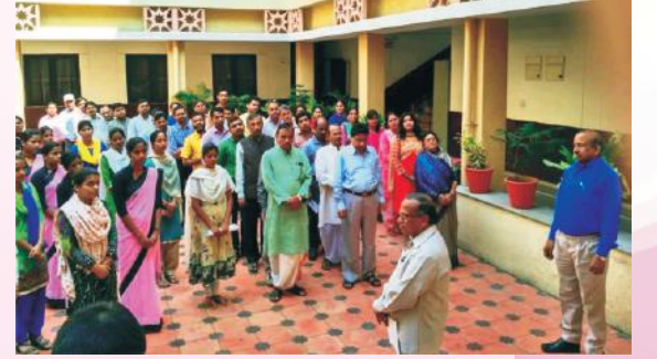
सतर्कताजागरूकताशपथं स्वीकुर्वाणाः परिसरसदस्याः