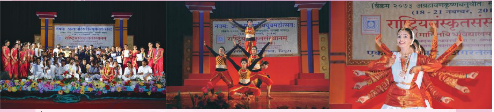
विजयवैजयन्त्या सह राजीवगान्धीपरिसरगणः