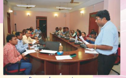
प्रशिक्षणकार्यक्रमस्य एकं दृश्यम्