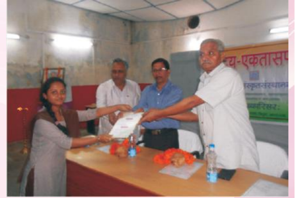
पुरस्कारं वितरन्तः अतिथयः