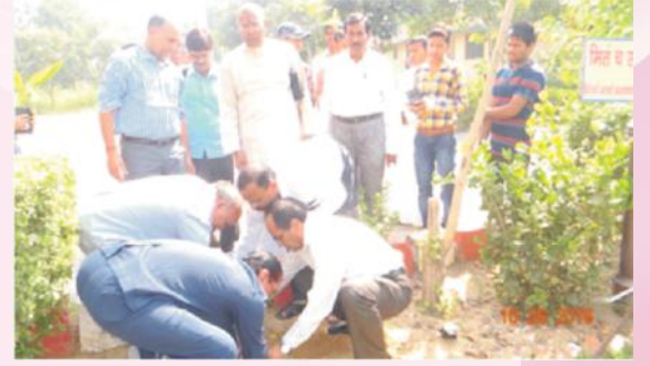
वृक्षारोपणस्य एकं दृश्यम्