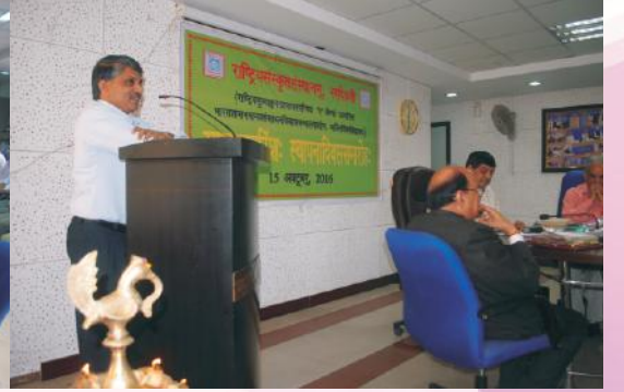
धन्यवादं समर्पयन् कुलसचिवमहोदयः