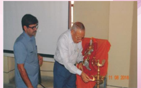
दीपं प्रज्वलयति अतिथिमहोदयः