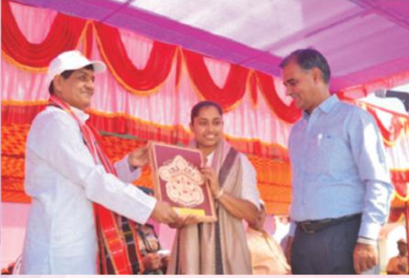
युवमहोत्सवे मुख्याभ्यागतां दीपाकर्माकरमहाभागां (ओलम्पिकप्रतिभागिनी) सम्मानयति कुलपतिवर्यः