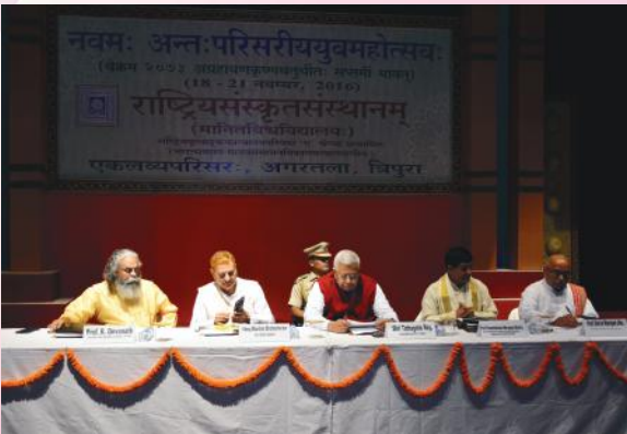
युवमहोत्सवस्य सम्पूर्तिसत्रे मञ्चासीनाः महामहिमराज्यपालाः श्रीतथागतारायवर्याः अतिथयश्च

देवस्य पश्य काव्यं न ममार न जीर्यति- अथर्व।