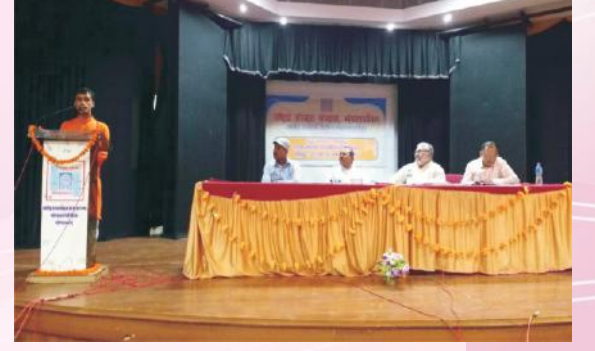
राज्यस्तरीयस्पर्धायां भाषमाणः छात्रः