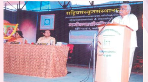
शारदाविशिष्टव्याख्यानमालायां व्याख्यानं विदधानः अतिथिवर्यः