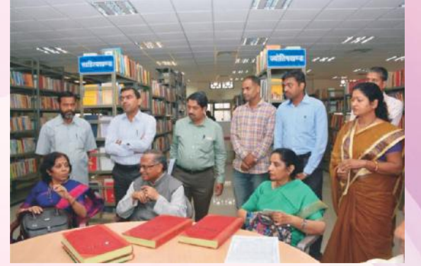
विश्वविद्यालयानुदानायोगपुनरीक्षणसमितेः पर्यवेक्षणस्य एकं दृश्यम्

नवम्बरमासस्य ०४ दिनाङ्कतः ०६ दिनाङ्कपर्यन्तं पुनरीक्षणसमित्या भोपालपरिसरस्य पर्यवेक्षणं विहितम्। त्रिदिवसात्मके अस्मिन् कार्यक्रमे परिसरस्य बहुविध-समुपलब्धानि भौतिकसंसाधनानि, मानवसंसाधनानि च पर्यवेक्षितानि। प्रथमदिवसे परिसरेण प्रतिवेदनस्य प्रस्तुतीकरणं कृतम्, पुनश्च विद्यार्थिभिः प्राध्यापकैश्च सह अन्तःक्रिया जाता। द्वितीयदिवसे मुख्यतः भौतिकसंसाधनानां पर्यवेक्षणकृतम्, सायंकाले 'हास्यचूडामणि' प्रहसनस्य पुनरीक्षण-समितिसमक्षे मञ्चनमभवत्। तृतीयदिवसे छात्रावासादयः सुविधाः पर्यवेक्षिताः।