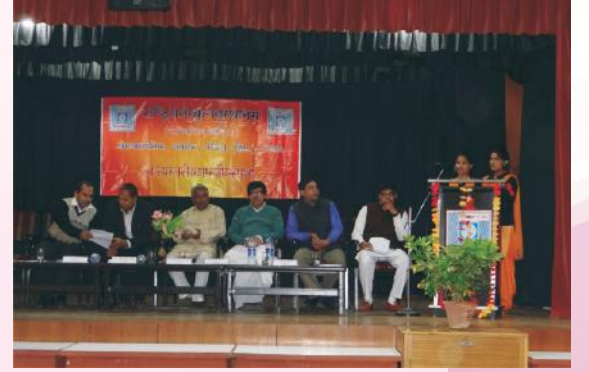
राज्यस्तरीयस्पर्धायाः एकं दृश्यम्