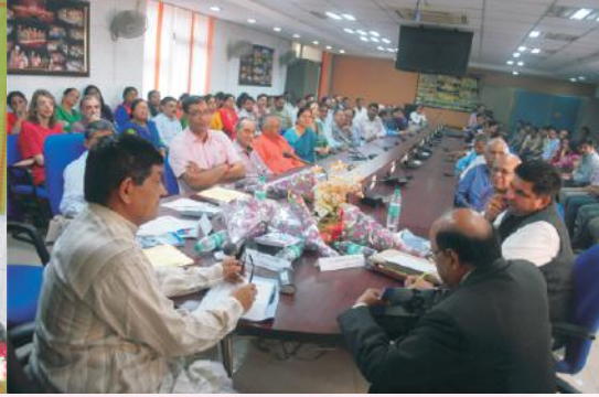
स्थापनादिवसकार्यक्रमस्य एकं दृश्यम्