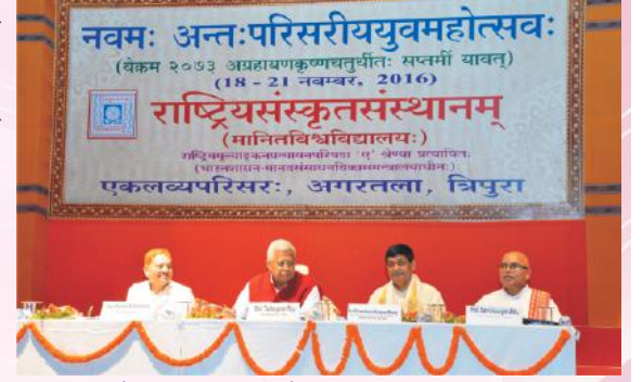
युवमहोत्सवस्य सम्पूर्तिसत्रे मञ्चासीनाः महामहिमराज्यपालाः