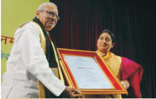
महामहोपाध्यायोपाधि संप्रददाना मन्त्रिवर्या