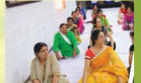
सुखासने उपविष्टाः मुख्यालयसदस्याः