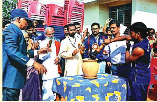
क्रीडास्पर्धोद्घाटनस्य एकं चित्रम्