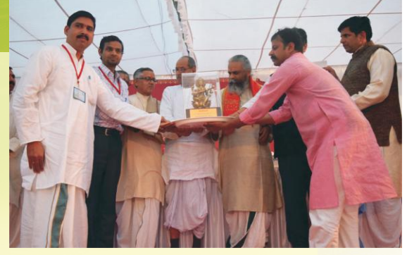
विजयवैजयन्तीपुरस्कारं प्रयच्छन् अतिथिगणः