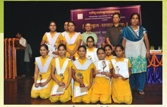
पुरस्कृतच्छात्रैः सह अतिथिगणः

२६.०८.२०१५ दिनाङ्के संस्कृतसप्ताहोत्सवस्य उद्घाटनसमारोहः मानवसंसाधनविकासमन्त्रालयः, राष्ट्रियसंस्कृतसंस्थानम्, श्रीलालबहादुरशास्त्रिराष्ट्रियसंस्कृतविद्यापीठम्, संस्कृतविभागः दिल्लीविश्वविद्यालयः, विशिष्टसंस्कृताध्ययनकेन्द्रम् जे.एन्.यु., गोस्वामी गिरधारीलालप्राच्यविद्याप्रतिष्ठानम्, दिल्ली-संस्कृत-अकादमी, संस्कृतविभागः, एन.सी.ई.आर.टी, देववाणी परिषद्, अखिलभारतीयसंस्कृत-