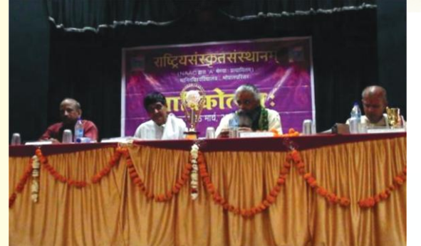
वार्षिकोत्सवे मञ्चासीनः अतिथिगणः