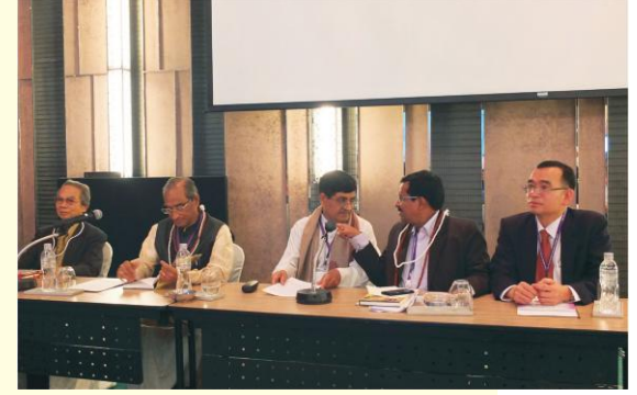
विश्वसंस्कृतसम्मेलने मञ्चे विराजमानः अतिथिगणः