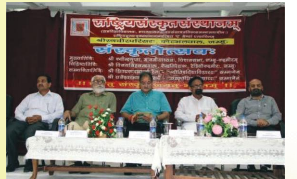
संस्कृतोत्सवस्य एकं दृश्यम्

अन्ताराष्ट्रीययुवदिवसस्य आयोजनम् अगस्तमासस्य द्वादशदिनाङ्के अभूत्।