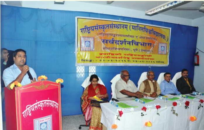
राष्ट्रीयसङ्गोष्ठ्याः उद्घाटनसत्रस्य दृश्यम्