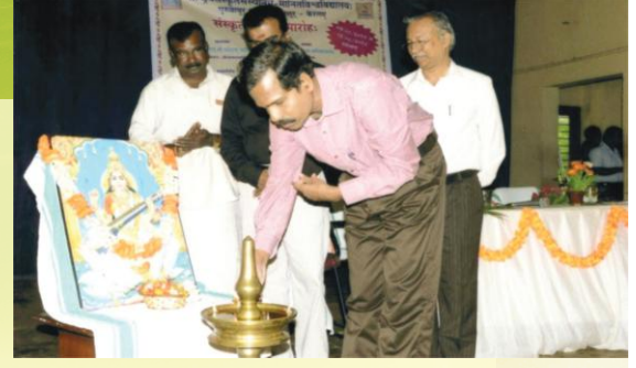
संस्कृतसप्ताहोत्सवस्य उद्घाटनस्य दृश्यम्

३१.१०.२०१४ दिनाङ्के सरदारबल्लभभाईपटेलवर्यस्य जन्मदिवसमुपलक्ष्य परिसरेण राष्ट्रिय-एकतादिवसः कार्यक्रमः समनुष्ठितः। दिवसेऽस्मिन् वादविवादादि-नैककार्यक्रमाः अभूवन्, परिसरीयाः छात्राध्यापक-कर्मचारिणः सोत्साहं भागम् अजरीगृह्यन्तः।