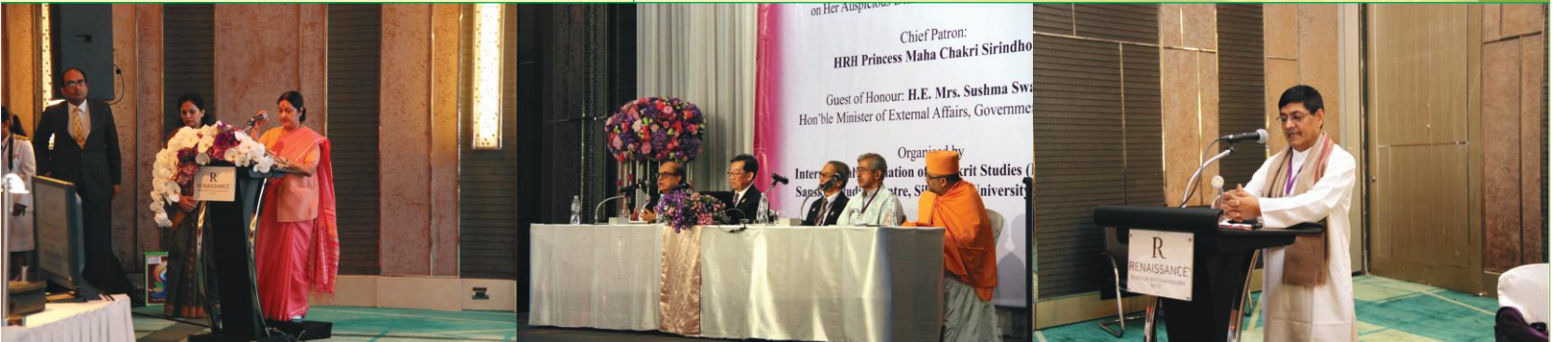
विश्वसंस्कृतसम्मेलने भाषमाणा श्रीमती सुषमास्वराजवर्या