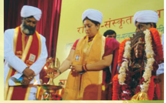
पञ्चमदीक्षान्तसमारोहम् उद्घाटयन्ती श्रीमती स्मृति जुबिन ईरानी-महोदया