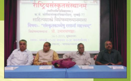
व्याख्यानमालायाः एकं दृश्यम्