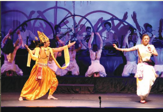
सांस्कृतिककार्यक्रमस्य एकं चित्रम्