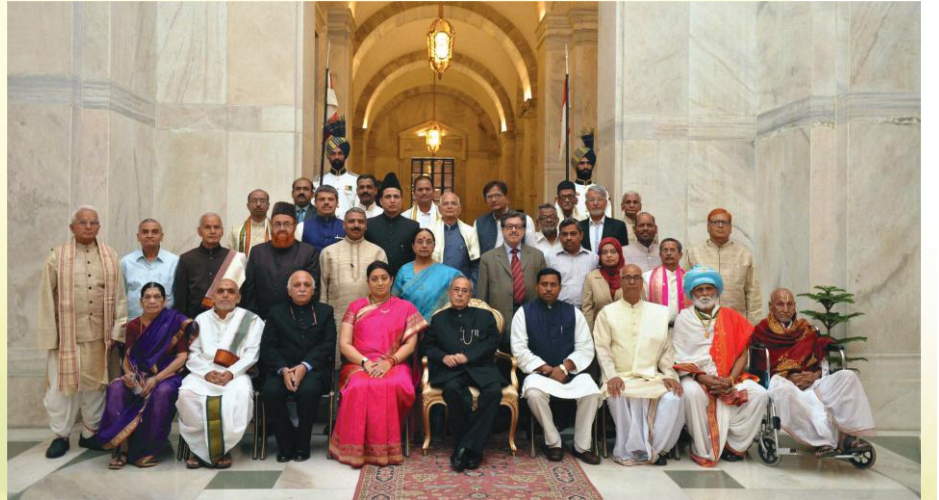
२०१५तमे वर्षे राष्ट्रपतिसम्मानभाजां विदुषां समूहचित्रम्