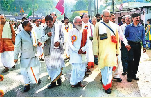
शोभायात्रायाम् अतिथिभिः सह प्राचार्याः

राष्ट्रिय संस्कृतसंस्थानस्य विशिष्टेषु कार्यक्रमेषु अन्यतमः अन्तःपरिसरीयः युवमहोत्सवः। सप्तमः अन्तःपरिसरीयः युवमहोत्सवः शृङ्गेरीस्थ-राजीवगान्धीपरिसरे सम्पन्नः। अस्मिन् महोत्सवे राष्ट्रियसंस्कृतसंस्थानस्य एकादश-परिसरेभ्यः समागताः छात्राः सोत्साहं, सांस्कृतिक-क्रीडा-शैक्षिकस्पर्धासु भागं गृहीतवन्तः। युवमहोत्सवस्य शोभायात्रायां विविधेभ्यः परिसरेभ्यः समागताः छात्राः तत्तद्-राज्यस्य संस्कृतिप्रतिभूतेन वेषेण भागम् अगृह्णन्। त्रिदिनव्यापिनि महोत्सवे शृङ्गेरीस्थ-राजीवगान्धीपरिसरः अधिकान् अङ्कान् अवाप्य विजयवैजयन्त्या विभूषितः। द्वितीयस्थानं जयपुरपरिसरेण तृतीयस्थानं वेदव्यासपरिसरेण च समलङ्कृतम्।