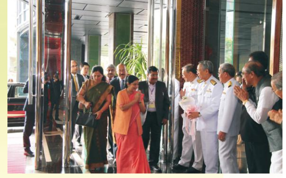
विश्वसंस्कृतसम्मेलनस्य उद्घाटनाय समागच्छन्ती श्रीमती सुषमास्वराजवर्या