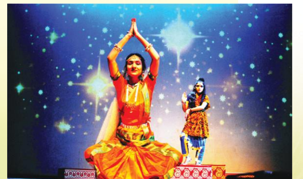
पूर्वरङ्गं प्रस्तुवन्तः कुशीलवाः