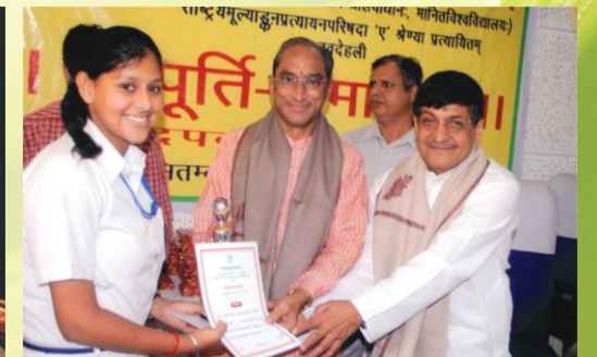
पुरस्कारं गृहाणा छात्रा