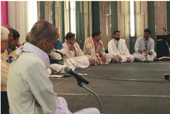
विदुषां शास्त्रचर्चायाः एकं दृश्यम्