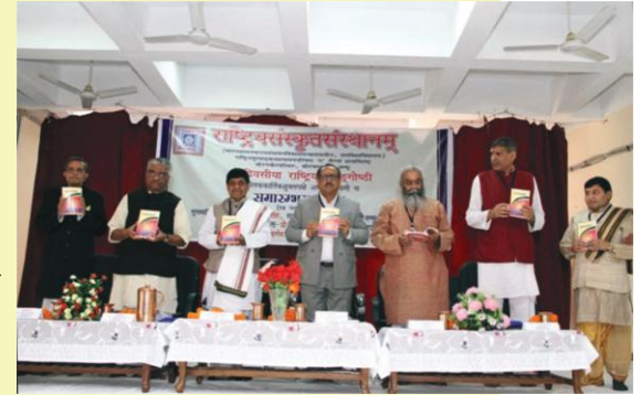
राष्ट्रीयसङ्गोष्ठ्यां पुस्तकं विमोचयन् अतिथिगणः

दिसम्बरमासस्य एकविंशतिदिनाङ्के गीतासमारोहस्य आयोजनं गांधीनगरे केन्द्रीयविद्यालयसंगठनसभागारे अभूत्। समारोहेऽस्मिन् बहवः विद्यालयच्छात्राः सोत्साहं भागमगृह्णन्।