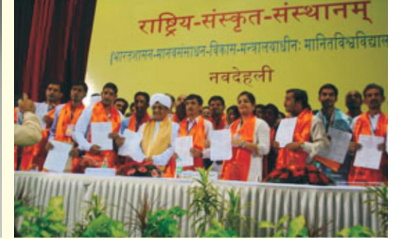
स्नातकं विद्यावारिधिं च उपाधि संगृहाणाः छात्राः