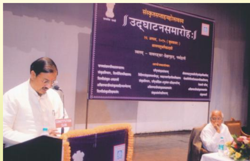
सम्बोधयन् माननीयराज्यमन्त्री डॉ. महेशशर्मा