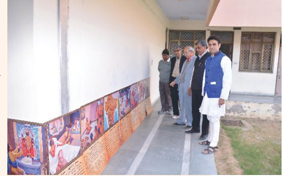
निरीक्षणं कुर्वाणः आचार्यगणः

महात्मागान्धिमहोदयस्य जन्मदिवसमालक्ष्य समायोजिते स्वच्छभारताभियानान्तर्गतत्वेन परिसरे विभागीयैः विद्यार्थिभिः आचार्यैश्च अहमहमिकया श्रमदानं कृतम्। अवसरेऽस्मिन् आचार्यैः स्वच्छताप्रतिज्ञायाः प्रत्यास्मरणं कारित्वा परिसरे आवर्षं यथासमयं स्वच्छतायै छात्राणाम् आह्वानमकारि।