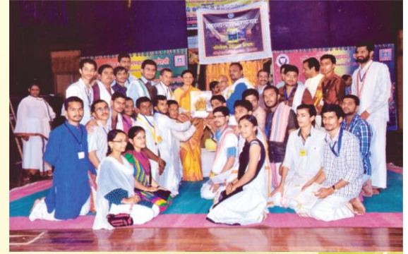
विजयवैजयन्त्या विभूषितः कर्णाटकगणः