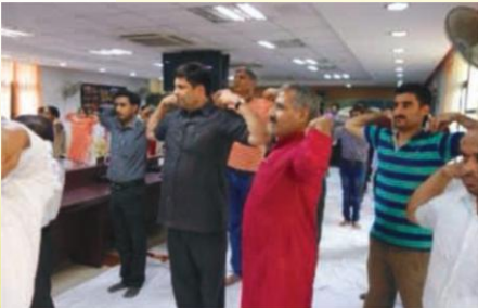
योगाभ्यासे रताः मुख्यालयीयाः

संस्थाने अन्ताराष्ट्रिययोगदिवसः २१.०६.२०१६ दिनाङ्के समाचरितः। कुलपतिप्रमुखा अन्ये अधिकारिणः भागम् अग्रहीषुः।