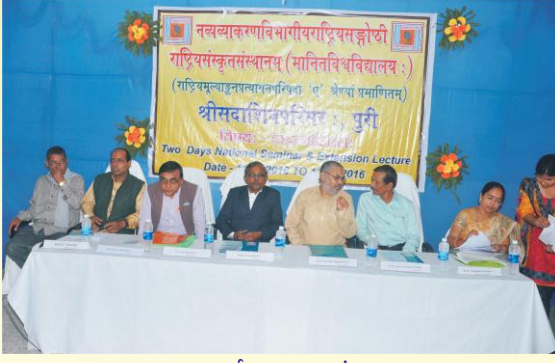
व्याख्यानमालाकार्यक्रमस्य एकं दृश्यम्