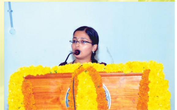
स्पर्धायां भाषणाणा छात्रा