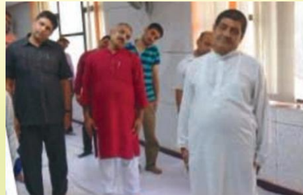
योगाभ्यासं कुर्वता कुलपतिना सह मुख्यालयीयाः