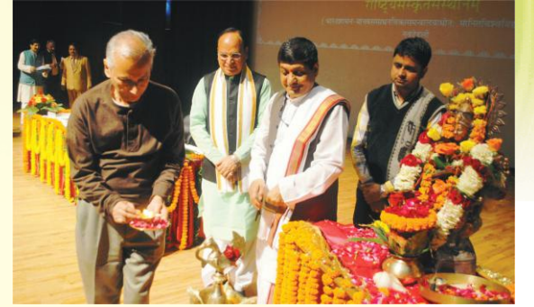
संस्कृतनाट्योत्सवम् उद्घाटयन् अतिथिगणः