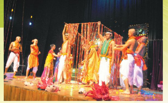
संस्कृतनाट्योत्सवे अभिनयन् छात्रगणः