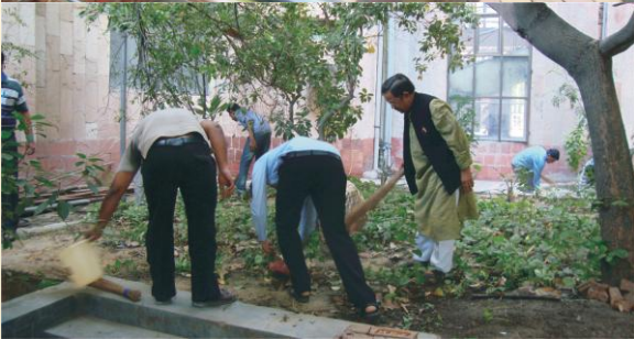
स्वच्छतां कुर्वन्तः मुख्यालयसदस्याः