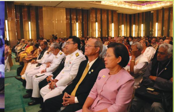
सम्मेलने विराजमानः पाश्चात्यभारतीयविद्वांसः