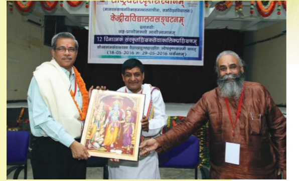
सम्मानयन् कुलपतिः प्राचार्यश्च