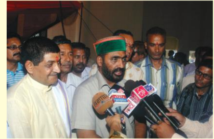
उद्घाटनकार्यक्रमस्य कानिचन दृश्यानि