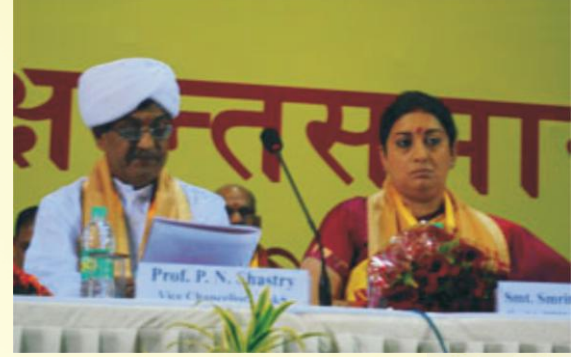
पञ्चमदीक्षान्तसमारोहे कुलपतिः मन्त्रिवर्या च