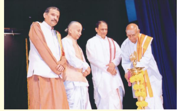
उद्घाटनकार्यक्रमस्य किञ्चन् दृश्यम्