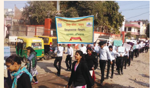
शोभायात्रायाः एकं दृश्यम्