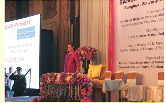
विश्वसंस्कृतसम्मेलने विराजमाना सयाम् बरोम् राजकुमारी महाचक्रीसिरिन्धोन्