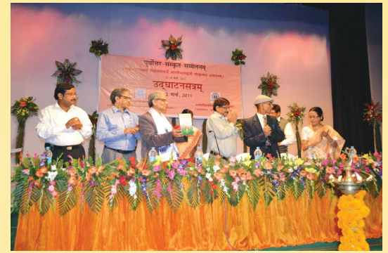
पूर्वोत्तरसंस्कृतसम्मेलने ग्रन्थलोकार्पणस्य किञ्चन दृश्यम्