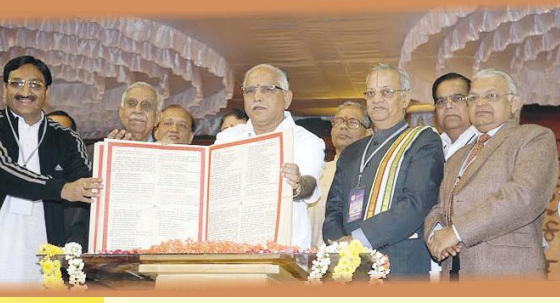
शब्दवेदं लोकार्पणन्तः बी.एस. येदुरप्पा प्रमुखविभूतयश्च

संस्कृतसम्बद्धग्रन्थानां विक्रयकेन्द्रापेक्षया भारतीयसंस्कृतेः भारतदर्शनस्य च किञ्चित् मेलनस्थलं प्रतिभाति स्म। पुस्तकमेलकाङ्गतया व्याख्यानमालाकार्यक्रमाः, चर्चासत्राणि, संस्कृतप्रचारकार्यशालाः, प्रदर्शिन्यः, सांस्कृतिककार्यक्रमाः, कविसम्मेलनानि ग्रन्थलोकार्पण-कार्यक्रमाश्च वैभवतया सुसम्पन्नाः।