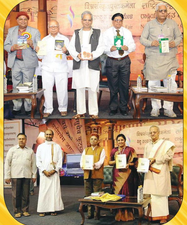
ग्रन्थलोकार्पणकार्यक्रमस्य कानिचन दृश्यानि