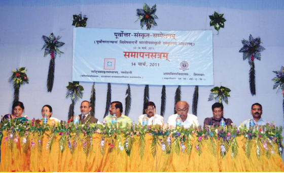
समापनसत्रस्य किञ्चन दृश्यम्

सम्मेलनेऽस्मिन् सत्रक्रमेण पूर्वोत्तरराज्यानां भाषाभिः सह संस्कृतस्य सम्बन्धः, पूर्वोत्तरराज्यानां भारतीयदर्शनेषु प्रभावः, संस्कृते मूल्यतन्त्रमथ च पूर्वोत्तरराज्यीयकाव्येषु भारतीयमहाकाव्यानां प्रभावः, पूर्वोत्तरराज्येषु भक्त्यान्दोलनम्, पूर्वोत्तरराज्यानां परिप्रेक्ष्ये भारतीयसंस्कृतेः संवर्द्धनम्, संस्कृतं पूर्वोत्तरभाषाश्च, पूर्वोत्तरराज्येषु भारतीयसंस्कृतेः विभिन्नविधानां प्रभावः चेति विषयेषु चर्चासत्राणि प्रवृत्तानि। विभिन्नैः विद्वद्भिः उपरिनिर्दिष्टांशेषु सुष्ठुरीत्या स्वाभिप्रायः प्रकटितः।