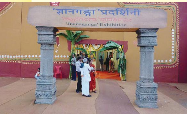
'ज्ञानगङ्गा'-प्रदर्शिन्याः द्वारस्य दृश्यम्