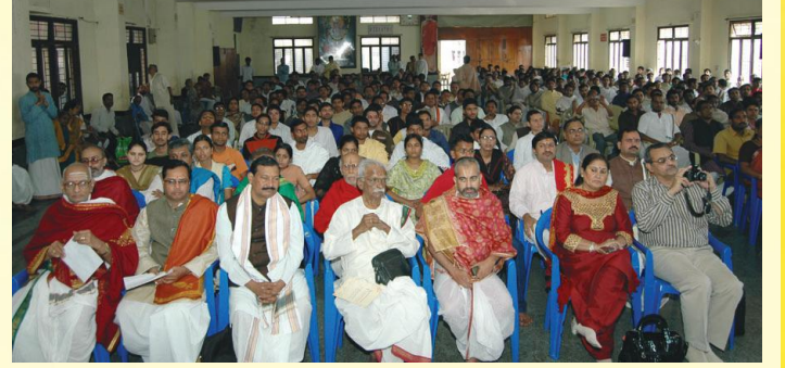
कार्यक्रमम् अवलोकयन्त: प्रेक्षका: