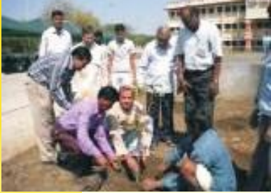
वृक्षारोपणस्य किञ्चन दृश्यम्