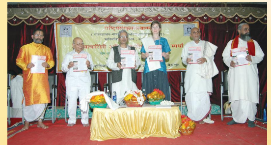
बेङ्गलूरुनगरे संस्कृतवार्तायाः पूर्वतनाङ्कं लोकार्पण्यन्तः विद्वांसः