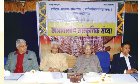
सांस्कृतिकसन्ध्यायाः किञ्चन दृश्यम्