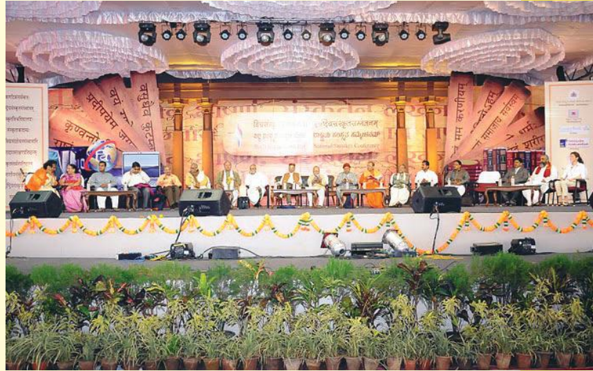
‘कविभास्करी’-अखिलभारतीयसंस्कृतकविसमवायस्य किञ्चन दृश्यम्