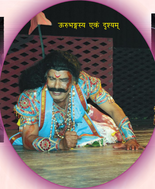
ऊरुभङ्गस्य एकं दृश्यम्