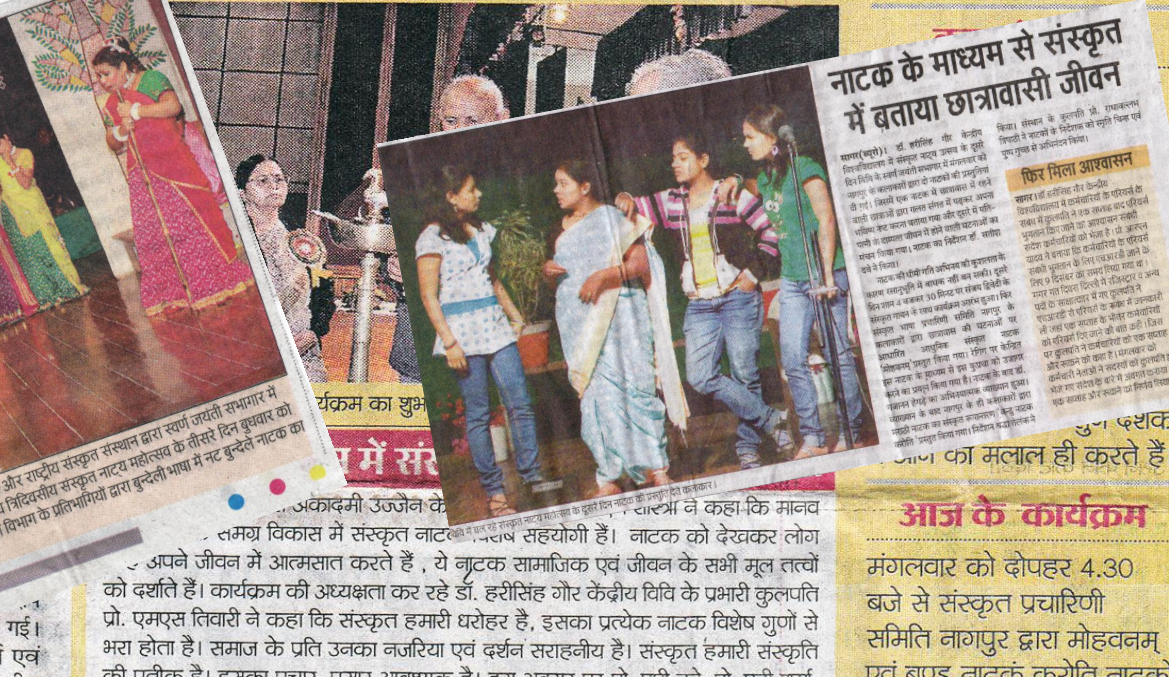
नाटक के माध्यम से संस्कृत में बताया छात्रावासी जीवन