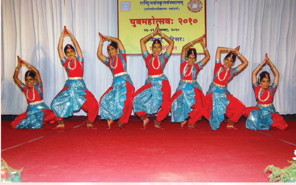
युवमहोत्सवस्य किञ्चिद् दृश्यम्