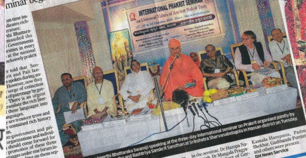
International Prakrit Seminar in Hassan