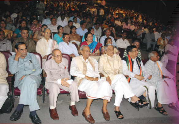
नाटकानि प्रेक्षन्तः सुधियः प्रेक्षकाः