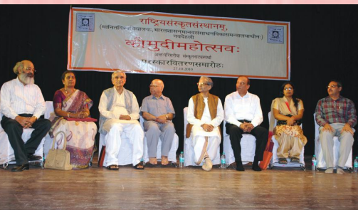
कौमुदीमहोत्सवस्य पुरस्कारवितरणसमारोहे कुलपतिना समं नाट्यविशारदाः