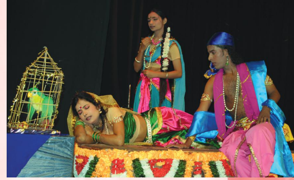
अविमारकस्य किञ्चिद् दृश्यम्