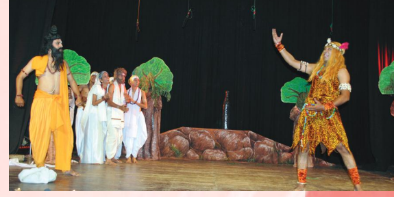
मध्यमव्यायोगस्य किञ्चिद् दृश्यम्