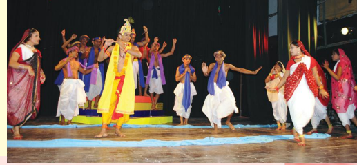
बालचरितस्य किञ्चिद् दृश्यम्

प्रत्येकं रूपके प्रथम-द्वितीय-तृतीयक्रमेण पुरस्कारभाजः कुशीलवाः -