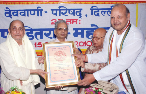
संस्थानस्य स्थापनादिवससमारोहावसरे रेवाप्रसादद्विवेदिनं पण्डितराजपुरस्कारेण सम्मानयन्तः विद्वांसः।