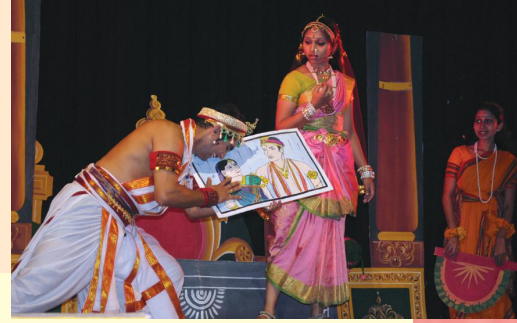
स्वप्नवासवदत्तस्य किञ्चिद् दृश्यम्

सर्वश्रेष्ठ-अभिनेतृ-अभिनेत्री-पुरस्कारभाजः -