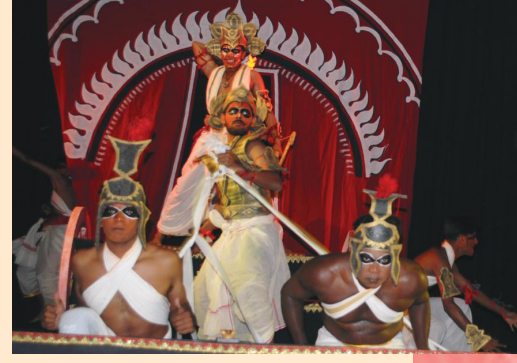
कर्णभारस्य किञ्चिद् दृश्यम्

जम्मूस्थ-श्रीरणवीरपरिसरेण प्रस्तुतं प्रतिमानाटकं विशेषपुरस्कारपात्रं सञ्जातम्।