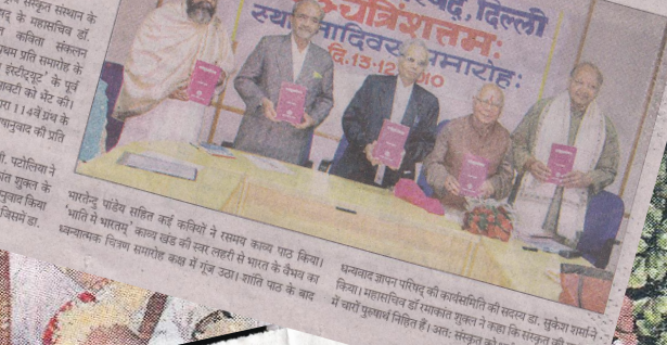
स्थापना दिवस पर अभिनंदन और प्रतियोगिता