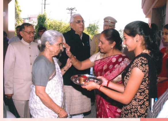
अतिथीनां किञ्चन स्वागतदृश्यम्