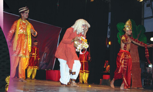
प्रतिज्ञायौगन्धरायणस्य किञ्चिद् दृश्यम्