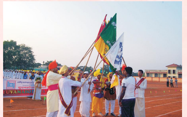
उद्घाटनकार्यक्रमस्य किञ्चन दृश्यम्