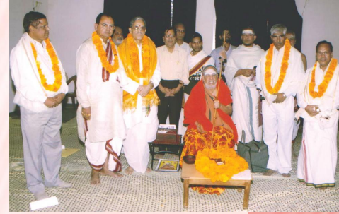
स्वामिपादः शुभाशीर्वादं प्रयच्छन्