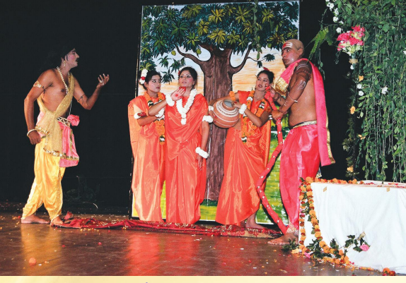
जयपुरपरिसरेण मञ्चितः शाकुन्तल-षष्ठाङ्कः