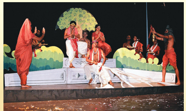
गुरुवायूरुपरिसरेण मञ्चितः शाकुन्तल-सप्तमाङ्कः