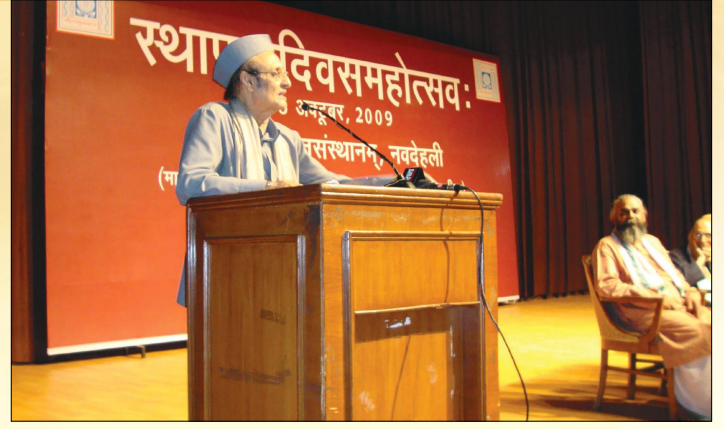
डॉ. राधाकृष्णन्-स्मृतिव्याख्यानं कुर्वन् कर्णसिंहः