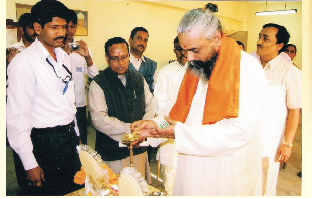
शिक्षाशास्त्रविभागीयसङ्गणकप्रयोगशालाम् उद्घाटयन् कुलसचिवः।