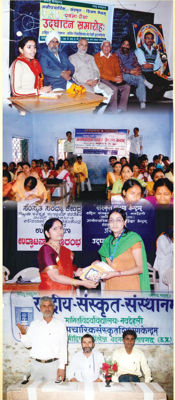
विभिन्नप्रदेशेषु प्रवृत्तानां केन्द्राणां सम्बद्धानि कानिचन चित्राणि