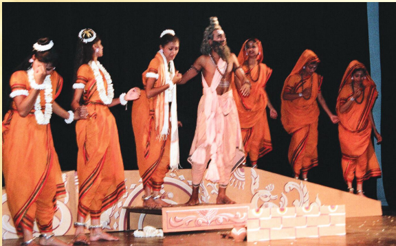
शृङ्गेरीपरिसरेण मञ्चितः शाकुन्तल-चतुर्थाङ्कः