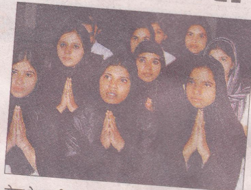
मेरठ के सनबीम स्कूल में श्लोक पढ़ती मुस्लिम छात्राएं।

डा. अल्लामा इकबाल ने कहा था, 'मजहब नहीं सिखाता आपस में बैर रखना' लेकिन फिर भी लोग भाषा और मजहबी झगड़ों में उलझे हैं। दूसरी ओर, शिक्षा का एक मंदिर ऐसा भी है, जहां न तो धर्म की दीवारें हैं और न जुबान को बंदिश। यहां के 40 मुस्लिम बच्चों के कंठ में कुरान-ए-पाक की आयतों की जितनी रवानी है, उतनी ही संस्कृत के गूढ़ मंत्रों की भी। खास बात यह है कि इस विद्यालय के प्रबंधक भी मुसलमान हैं। यह पहल सांप्रदायिक सौहार्द और अमन पसंदी का बेमिसाल नमूना तो है ही, खुशहाल सरजमीं पर नफरत की फसल उगाने की तमन्ना रखने वालों को एक सबक भी है। दक्षिणानुसी विचारधारा के लोग आज भी उर्दू को मसलमानों की भाषा मानते हैं।