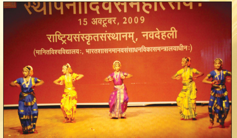
श्रीसर्वराया-हरिकथापाठशालायाः छात्राभिः प्रदर्शितं नृत्यम्