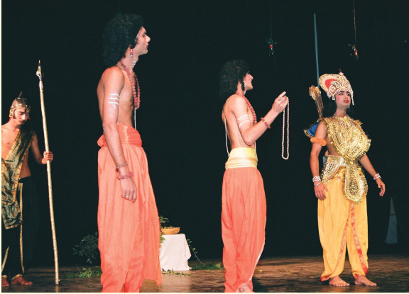
जम्मूपरिसरेण मञ्चितः शाकुन्तल-द्वितीयाङ्कः