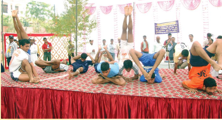
योगासनं प्रदर्शयन्तः छात्राः