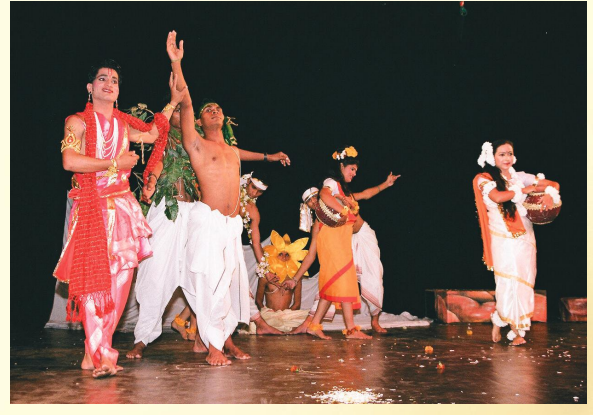
भोपालपरिसरेण मञ्चितः शाकुन्तल-प्रथमाङ्कः