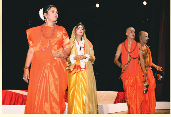
लखनऊपरिसरेण मञ्चितः शाकुन्तल-पञ्चमाङ्कः