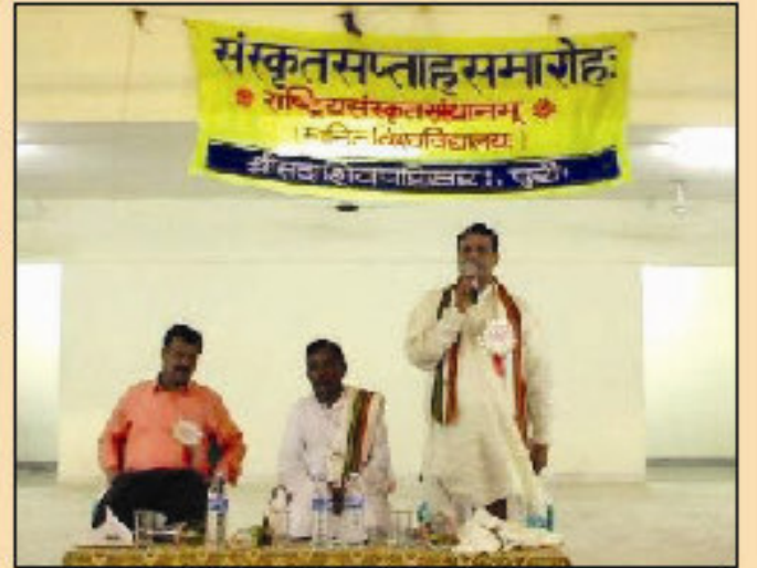
सभां सन्धेभयन् रात्र्यधीमहोत्सवः

वामतः दृश्यते तत्रुज्जुवाहरी, जी. मङ्गल च